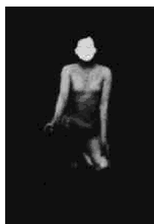
Pozice Hrom (The Thunderbolt)