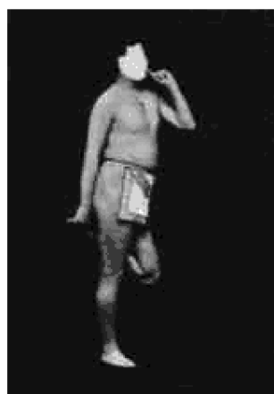
Pozice Ibis (The Ibis)

9. Až dosáhneš tohoto bodu tak, že během hodiny z misky naplněné po okraj vodou, kterou budeš mít na hlavě, neukápne ani kapka a až nebudeš dále vnímat nejjemnější otřes v kterémkoliv svalu; až, zkrátka, budeš cvičení zvládat snadno a klidně, budeš připuštěn ke zkoušce; a když uspěješ, dostaneš další instrukce o cvičení jenž budou komplikovanější a náročnější.